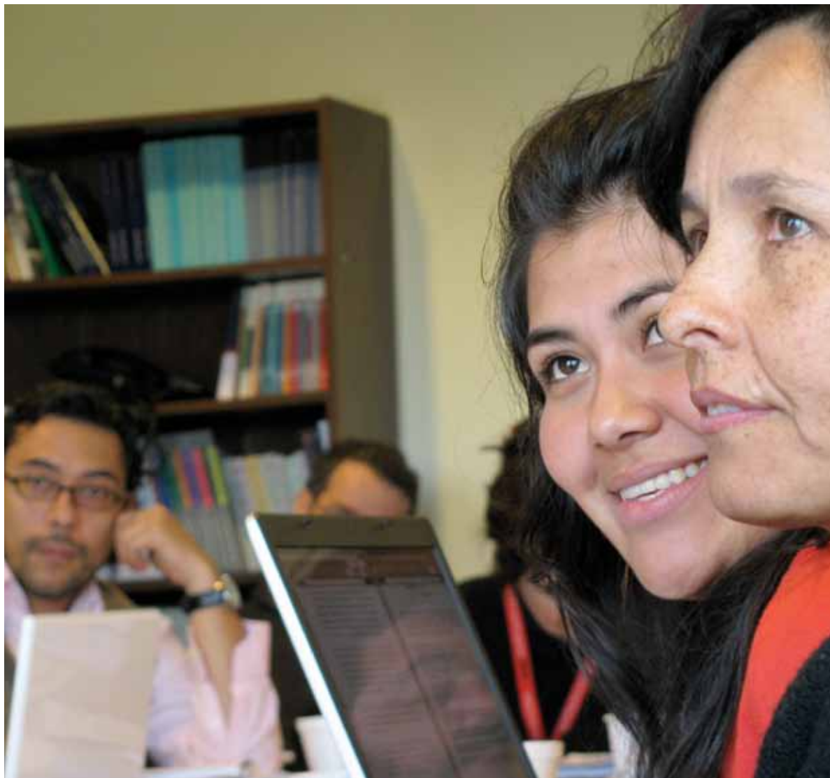
Defensores y defensoras de derechos humanos de todo el continente participaron en la reunión semestral de la Coalición Internacional de Organizaciones para los Derechos Humanos en las Américas, en la sede de CEJIL en Washington D.C. en octubre de 2008.