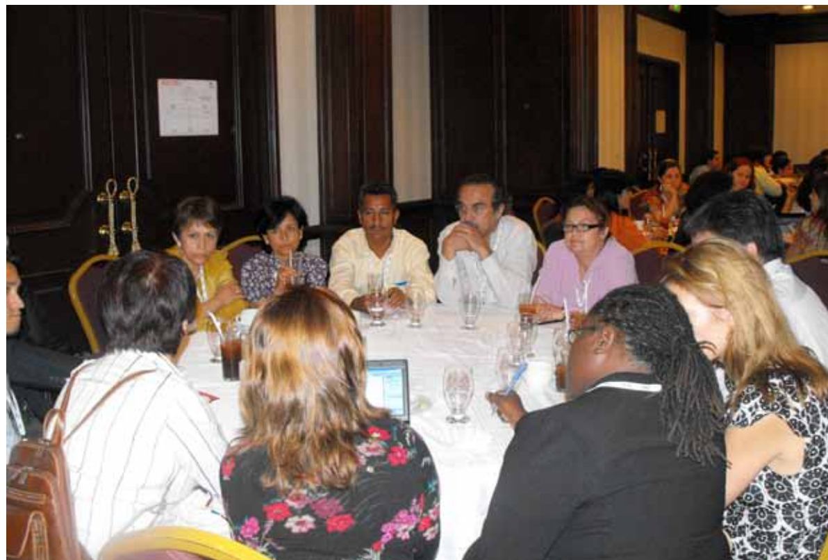
Defensores y defensoras de derechos humanos consensuaron la agenda de temas que presentarían al Secretario General de la OEA, José Miguel Insulza, durante la Asamblea General del organismo en San Pedro Sula, Honduras, en junio de 2009.