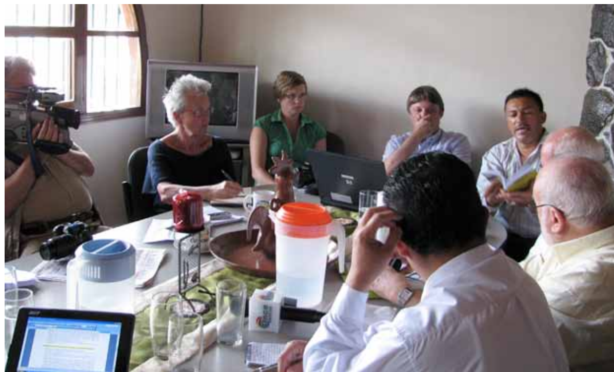
Integrantes del Observatorio Internacional sobre la Situación de Derechos Humanos en Honduras escuchan los testimonios de dirigentes de derechos humanos hondureños que sufrieron abusos durante el golpe de Estado.

CEJIL desplegó una intensa labor de difusión para obtener y difundir datos verificables, creíbles y rigurosos acerca de la magnitud de las violaciones de derechos humanos, para dar espacio y voz internacional a defensores y defensoras de derechos humanos y visibilizar a detenidos y víctimas. Así, organizó siete conferencias de prensa en San José y Washington sobre el golpe en Honduras, envió 30 comunicados de prensa y obtuvo