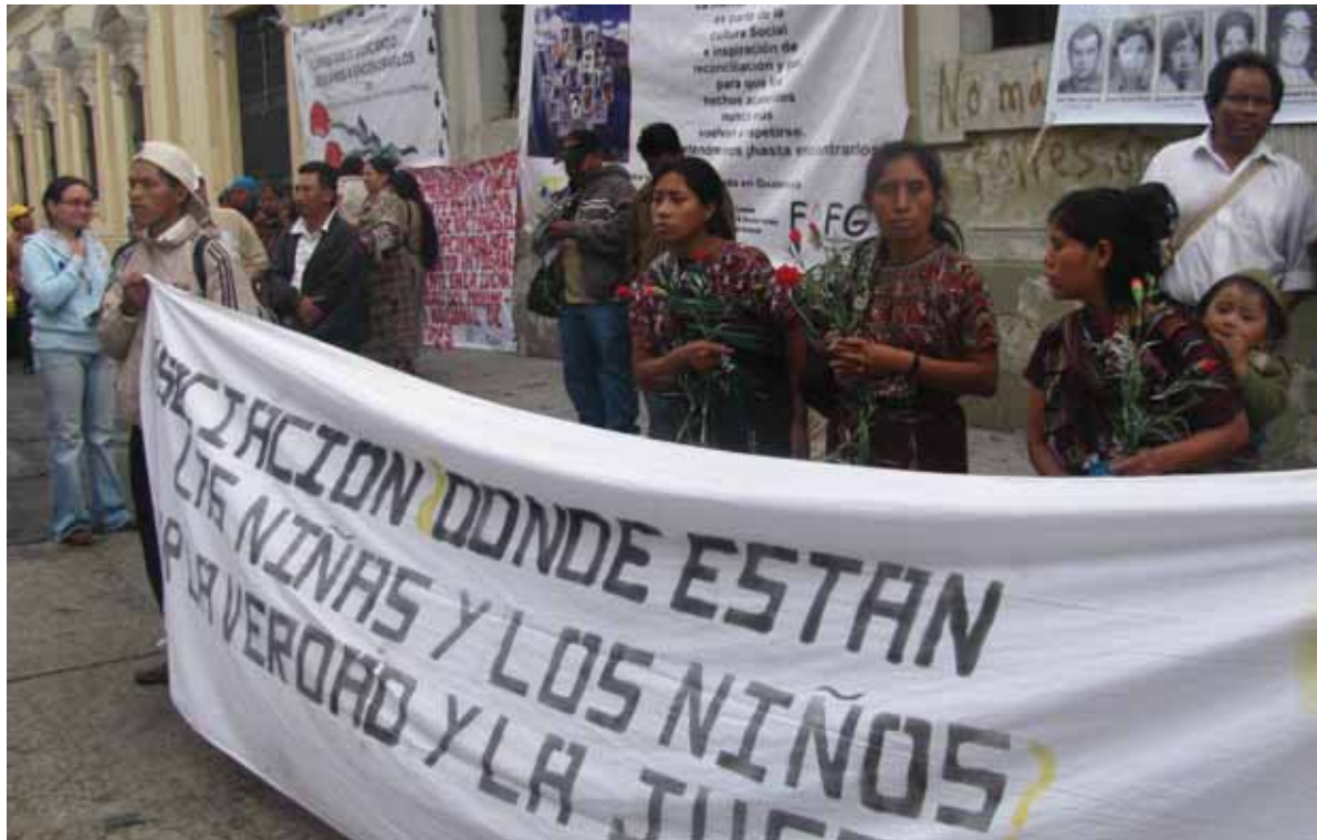
Acto en recuerdo de desaparecidos políticos en Guatemala. La justicia guatemalteca resolvió en diciembre de 2009 que las sentencias de la Corte Interamericana son de aplicación inmediata en el país, lo que permite reabrir investigaciones por violaciones a los derechos humanos que habían sido archivadas.

El último mes de 2009 marcó un paso importante para avanzar en la justicia en Guatemala, al declarar la Sala Penal de la Corte Suprema de Justicia que las sentencias de la Corte Interamericana en tres casos contra ese país eran autoejecutables, es decir, de aplicación inmediata y directa. Con tales decisiones, los tribunales internos reabrieron investigaciones archivadas durante años y ordenaron la detención de sospechosos de graves violaciones a los derechos humanos. Hasta entonces la justicia guatemalteca incumplía de manera flagrante las sentencias de la Corte Interamericana que disponían identificar, procesar y sancionar a los responsables de violaciones de derechos humanos.