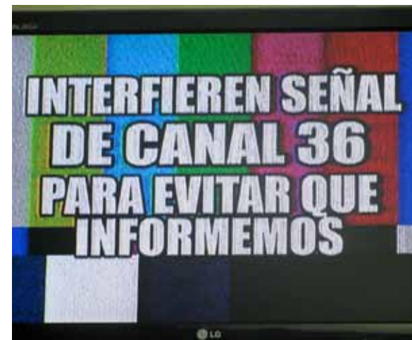
Los locales del Canal 36 fueron ocupados militarmente y la señal fue sacada del aire para impedir que difundiera información crítica del golpe de Estado.