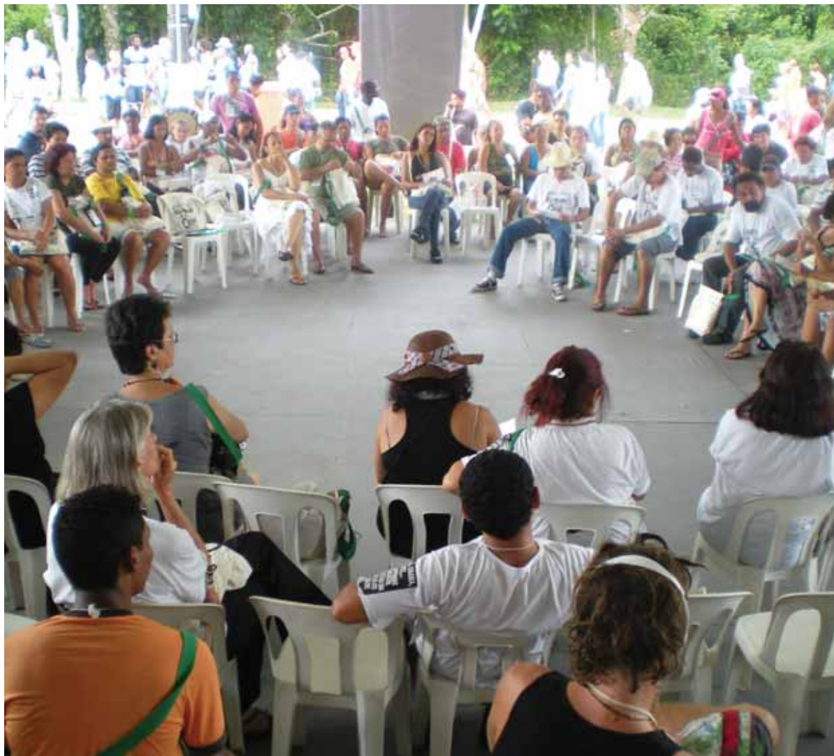
CEJIL participó en una charla llamada “Derecho a la verdad y a la memoria” sobre la revisión de la Ley de Amnistía en Brasil en el marco del Foro Social Mundial que se celebró en la ciudad de Belem do Para, en el Amazonas brasileño el 30 de enero de 2009.

En marzo de 2009, ante el incumplimiento de Brasil de las recomendaciones emitidas, la CIDH sometió el caso a la Corte Interamericana de Derechos Humanos.