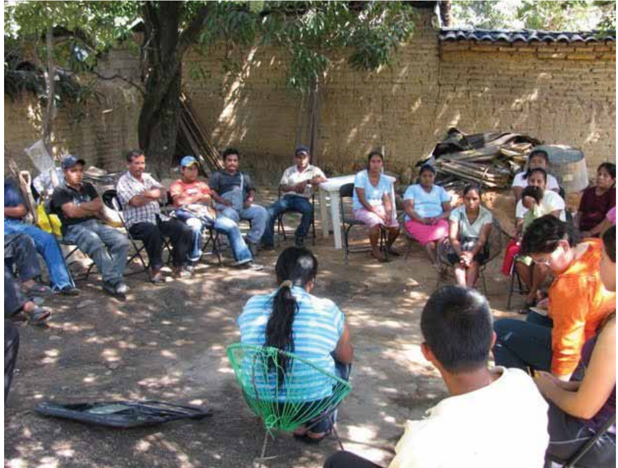
Representantes de organizaciones indígenas de defensa de los derechos humanos, en el Estado mexicano de Guerrero, reunidos para apoyar la lucha de dos mujeres que fueron violadas por militares.

Director Ejecutivo de la organización venezolana Espacio Público