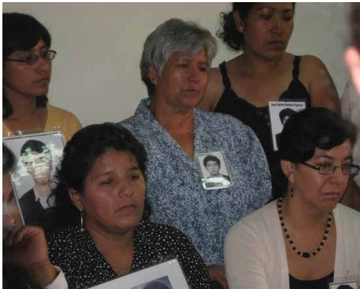
Familiares de víctimas de violaciones a los derechos durante el Gobierno de Alberto Fujimori y defensoras de derechos humanos participan en una conferencia de prensa, durante el juicio en el cual el ex Presidente fue condenado.