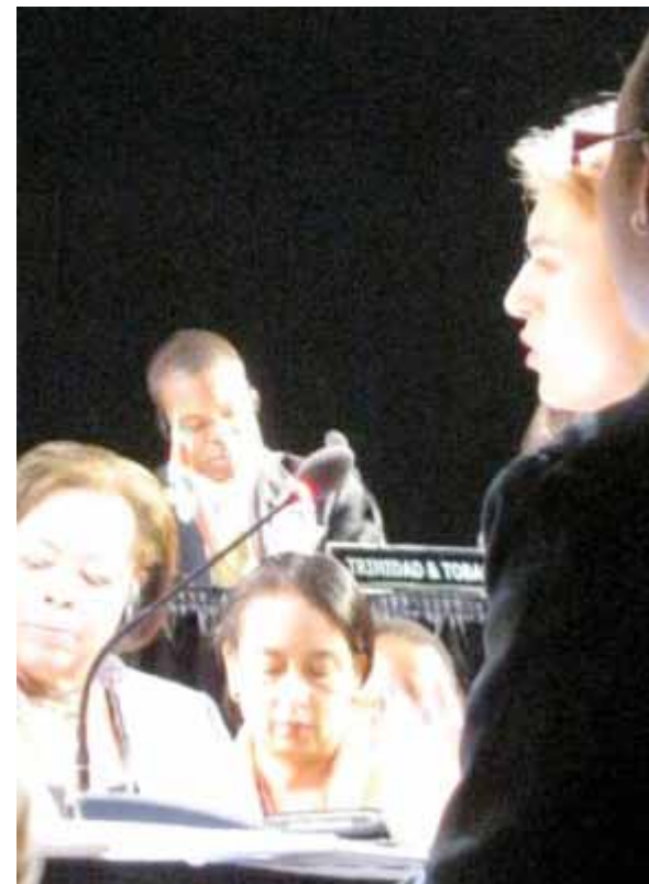
Durante la V Cumbre de las Américas, efectuada en Trinidad y Tobago en mayo de 2009, CEJIL ayudó a articular a las organizaciones de la sociedad civil para permitir una discusión más enriquecedora y la incorporación de sus propuestas.

CEJIL en la XXVIII Asamblea General de la OEA en Medellín, Colombia, en junio de 2008, coordinó junto con otras organizaciones de la sociedad civil posiciones comunes en torno al proceso de reformas de los reglamentos del Sistema Interamericano, también contribuyó a fortalecer la participación en la OEA de organizaciones no gubernamentales y participó en la redacción de los borradores de la Convención Interamericana contra el