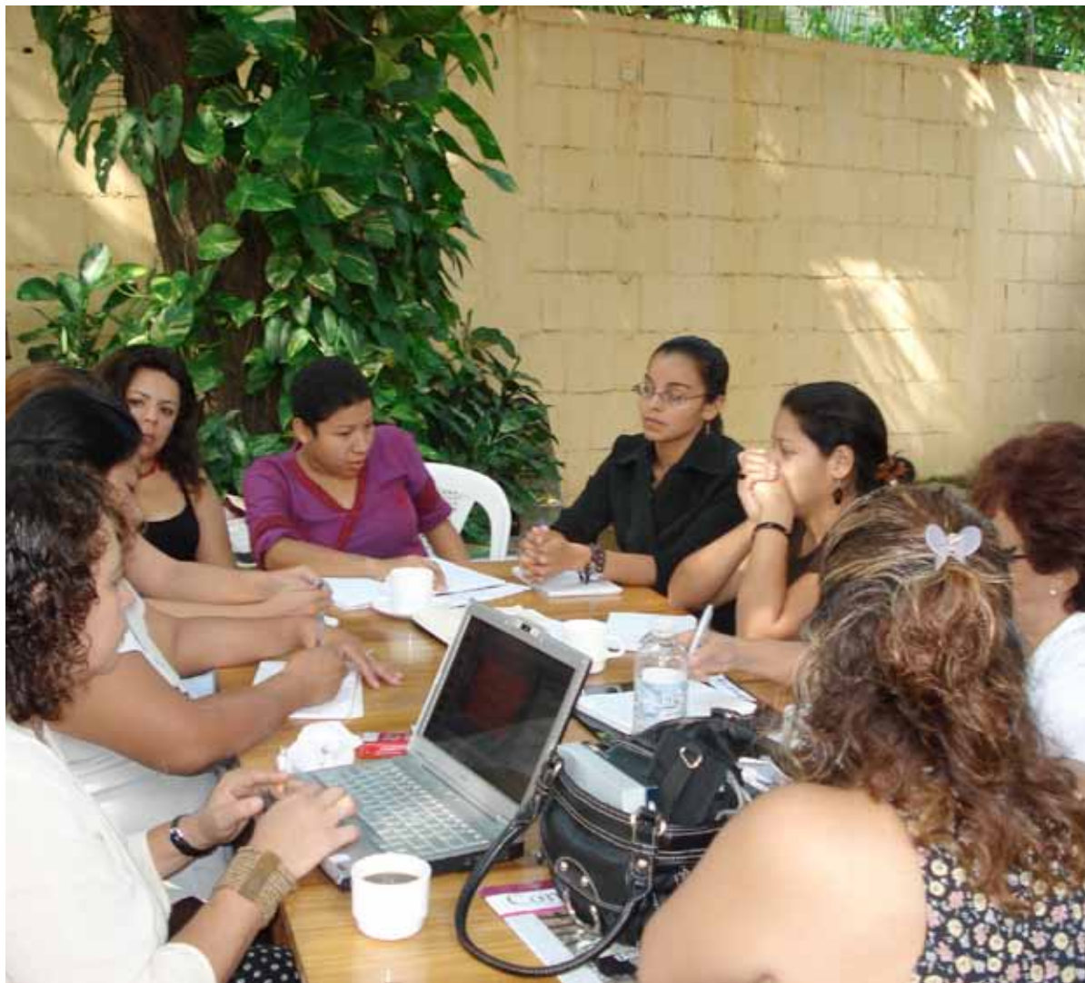
Defensoras de derechos humanos de Nicaragua discuten en grupos durante una de las sesiones del seminario internacional "Porque la vida de cada mujer cuenta", co-organizado por CEJIL en Managua, Nicaragua, en septiembre de 2008.